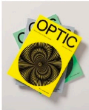
Counter-Print (Ed.): Optic. Ifold (Counter-Print) 2023, 200 Seiten. 25 Pfund. 978-1-9153920-6-0