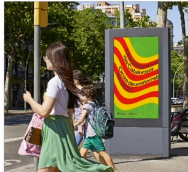
Nur ein Linienmuster ... aber mit Motion Design macht es die Agentur Forma am Nationalfeiertag zur sich »wehend« dahinschlingelnden Fahne Kataloniens.

❷ »Optic«. Abstrakt und überraschend – seit den 1950er Jahren bringt Op-Art zum Staunen und fänd schnell Eingang ins Design. Victor Vasarely selbst, quasi »Vater« der Kunstrichtung, gestaltete 1972 ein legendäres Renault-Logo. Der vierlinige Rhombus wurde 2021 mit zwei Linien wiederbelebt. Kein Wunder, abstrakte optische Effekte sind derzeit ein gestalterischer Megatrend. Der kleine britische Verlag Counter-Print legt dazu nun ein Buch mit zahlreichen Beispielprojekten vor. Bestehend ist vor allem die Gliederung nach verschiedenen Gestaltungsformen beziehungsweise -effekten, die das Auge leitet und methodisch inspiriert. Dazu gehören klassische Op-Art-Tricks wie das Spiel mit der Figur-Grund-Wahrnehmung oder täuschende Dreidimensionalität (wie eben beim Renault-Logo). Doch das Spektrum ist breiter, insbesondere natürlich bei typografischen Kunstgriffen. Wer direkt bei www.counter-print.co.uk bestellt, kann eine von drei Covervarianten mit effektiv drehbaren Scheiben aussuchen.